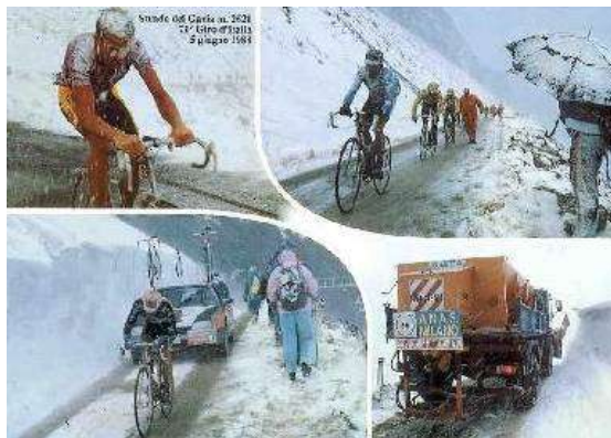
Passo di Gavia, Giro 1988.

El holandés pasó primero por la cima con 5º bajo cero. Pero el descenso a Bormio fue todavía peor. Los ciclistas se paraban en cada curva, se ponían toda la ropa de abrigo, se les derramaba té caliente por brazos y piernas, los frenos se bloqueaban, el cerebro no respondía, el cuerpo se colapsaba. Era como hacer un slalon de sky embutido en un traje de lycra minúsculo y las piernas al aire.